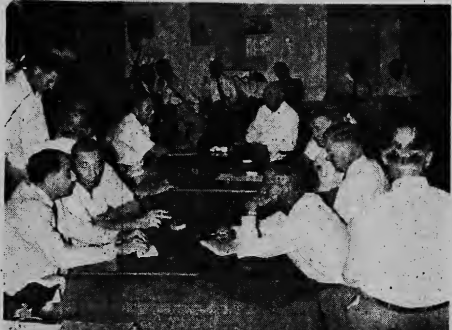
Esaki ta e mesa den oficina di Openbare Werken rondo di cual ayera tardi nan a tene e destajo entre e senjoranan constructores. Si hende mira e caballeronan ei sinti huntu conbersando y hardendo alegrement lo hende no por kere cu algun minuut despues lo a worde dicidi si nan esfuersonan y trabonan di e ultimo simannan lo worde corona of no. Pero naturalmente mesos cu tur otro caminda aki tambe lo no ta laga di tabatin basta tension y exaltacion.